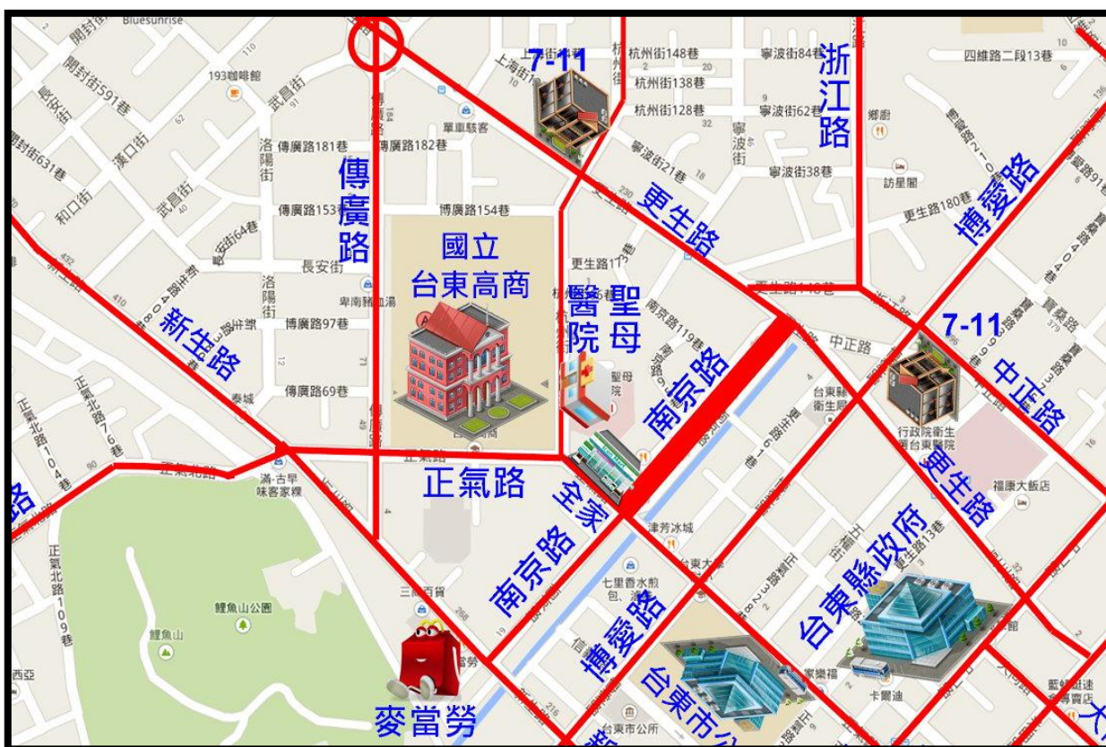
附圖一 承辦學校位置圖