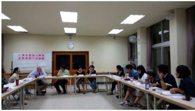
圖說：新任財務委員報告。