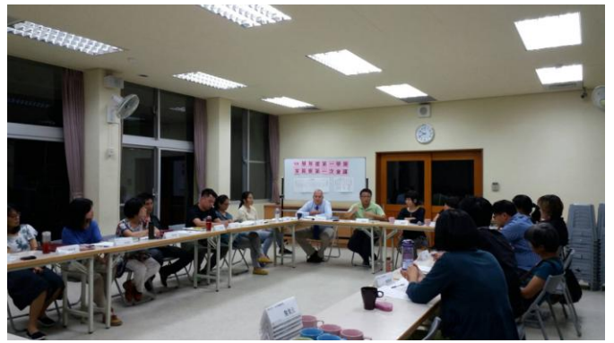
圖說：臨時動議及意見交換。