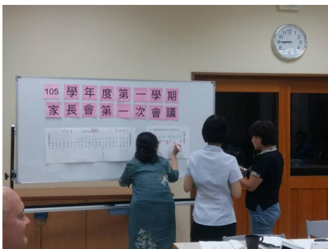
圖說：選舉常務委員。