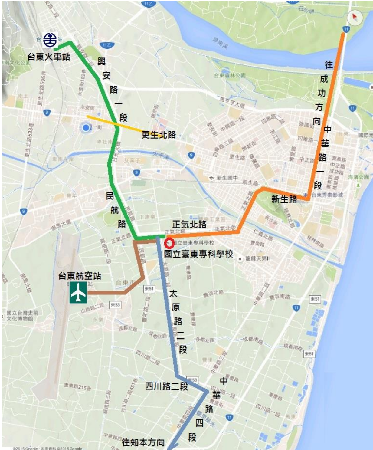
附圖一 國立臺東專科學校位置圖

網址 http:// www.ntc.edu.tw/ 地址: 臺東市正氣北路 889 號 電話: 089-230980 089-238118