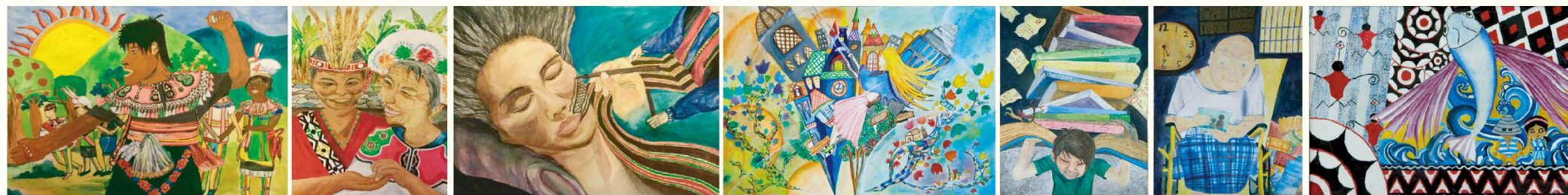
恭喜「第七屆全國原住民兒童繪畫創作比賽」獲獎同學(由左至右)：國小組特優-501柳葉喬《排灣族婚禮》 / 國中組特優-801陳或萱《攜手走過一甲子》、優等-802洪愷隆《泰雅·彩虹紋面》、國中組優等-702楊鄭宏《舞動生命》、802-洪愷隆《紓壓·書壓》、801-楊惟心、《我的爺爺》設計類 802-施詩卉《蘭嶼·圖騰》

天賦，是老天藏在每個人身上的禮物。嚴董事長曾說：「每個人最偉大、最精彩的作品就是自己。」均一努力提供孩子發展天賦的機會，更期待每位孩子能快樂地適性發展，讓天賦自由。