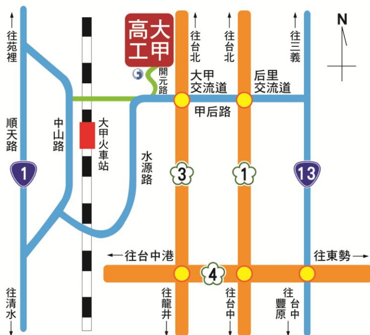
附圖一 承辦學校（臺中市立大甲工業高級中等學校）位置圖