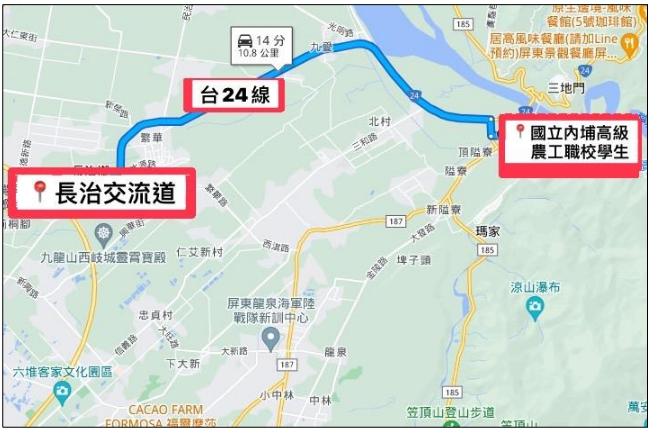
附圖一 承辦學校位置圖