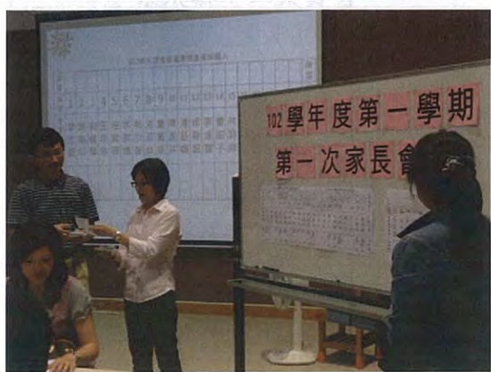
圖說：張會長監票、家長會秘書唱票。