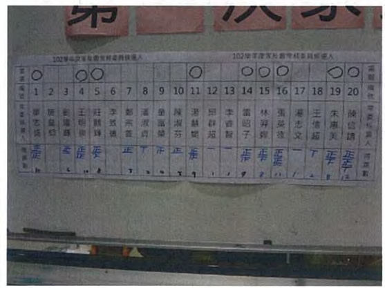
圖說：新任9位常務委員當選名單。