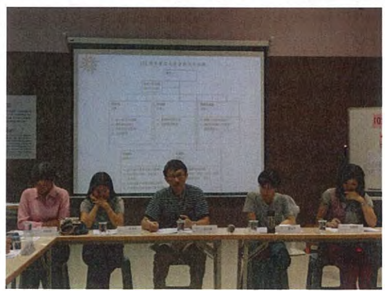
圖說：「102學年度家長會會務分工組織」討論中。