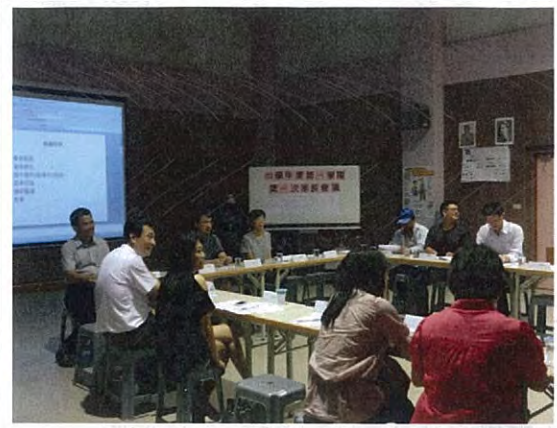
圖說：9月25日，召開102學年度「班級家長代表大會」