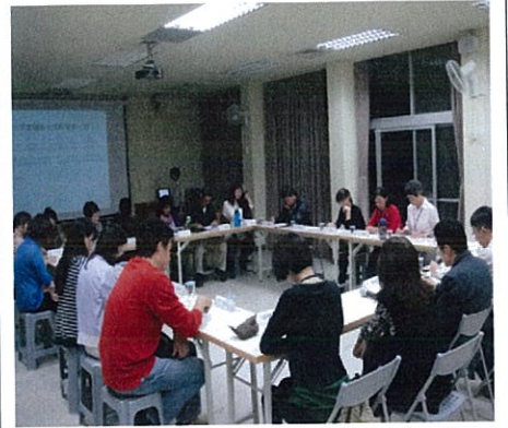
圖說：家長委員們出席狀況擁 躍。