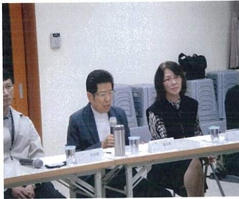
圖說：嚴董事長為委員們做 12 年 國教之解說。