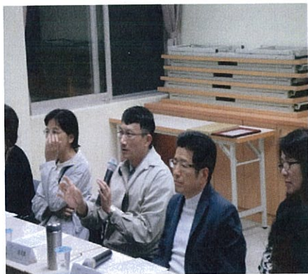
圖說：會長及委員們為會務熱烈 地討論提案。