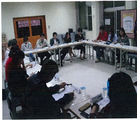
圖說：會長及家長委員們為會務 熱烈地討論提案。