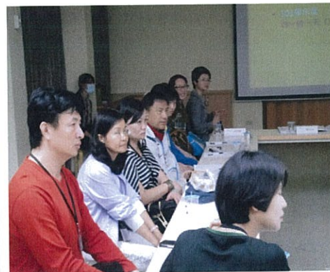
圖說：家長委員們仔細聆聽嚴董 事長解說。