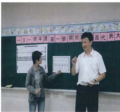
圖說：選舉常務委員及會長、副會長。