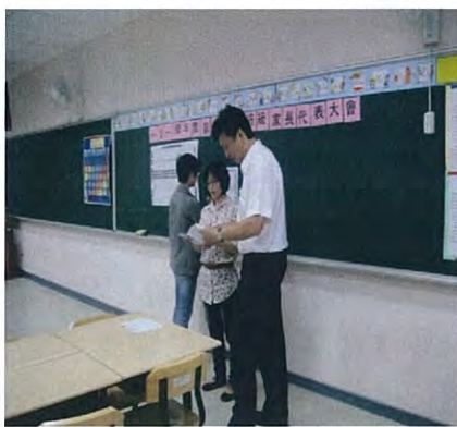
圖說：選舉常務委員及會長、副會長。