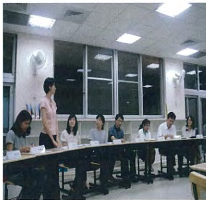
圖說：班級家長代表相互認識，自我介紹。