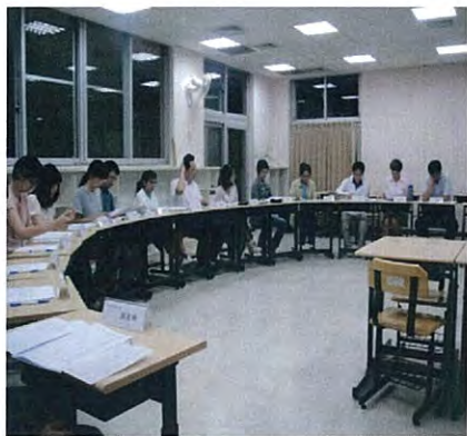
圖說：9月26日召開101學年度班級學生家長代表大會。