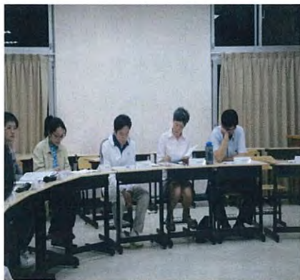
圖說：財務委員報告最新家長會帳務收支明細表。