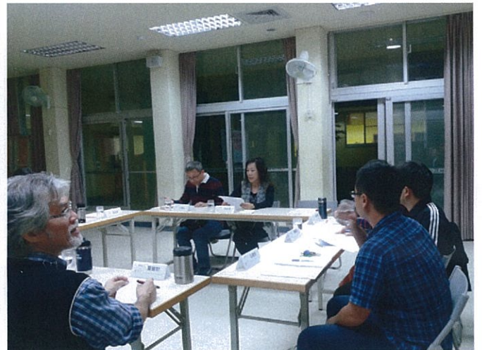
圖說：財務委員進行 103 學年度家長會財務報告。