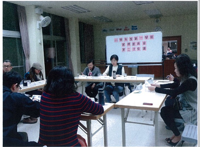
圖說：103 年 12 月 09 日召開常委會第二次會議。