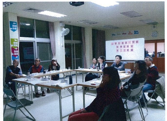
圖說：103 年 12 月 09 日召開常委會第二次會議。