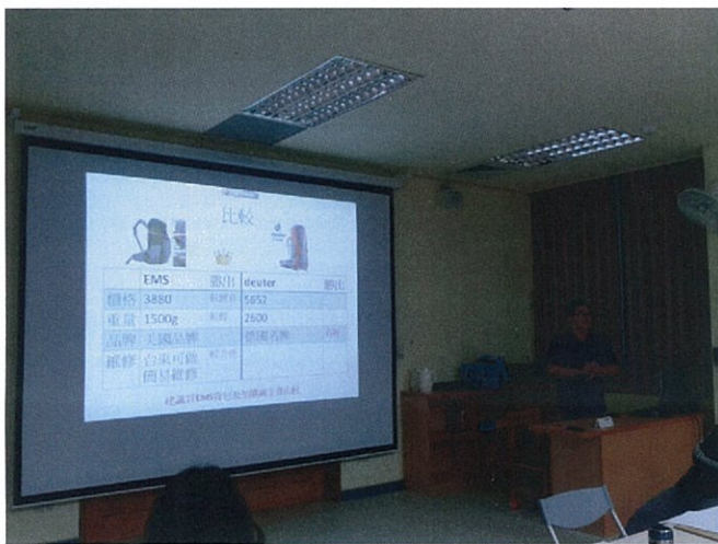
圖說：總務主任回覆採購及詢價登山背包。