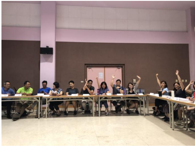
圖說：選(推)舉各項委員。