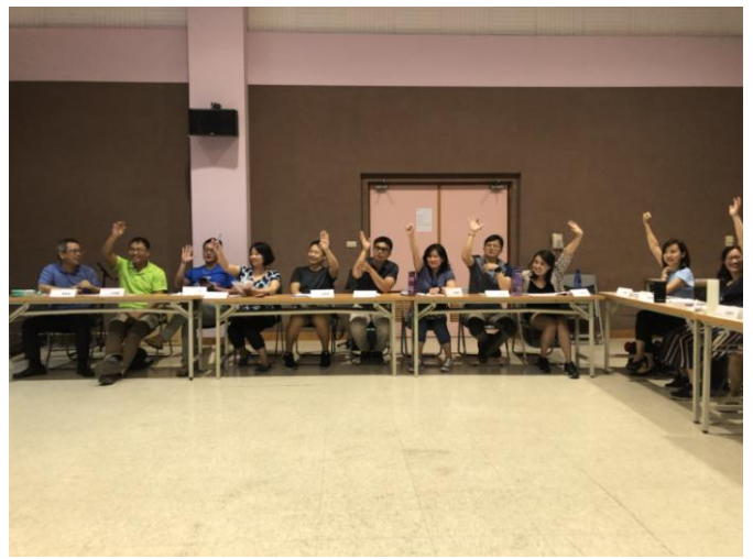
圖說：選(推)舉各項委員。