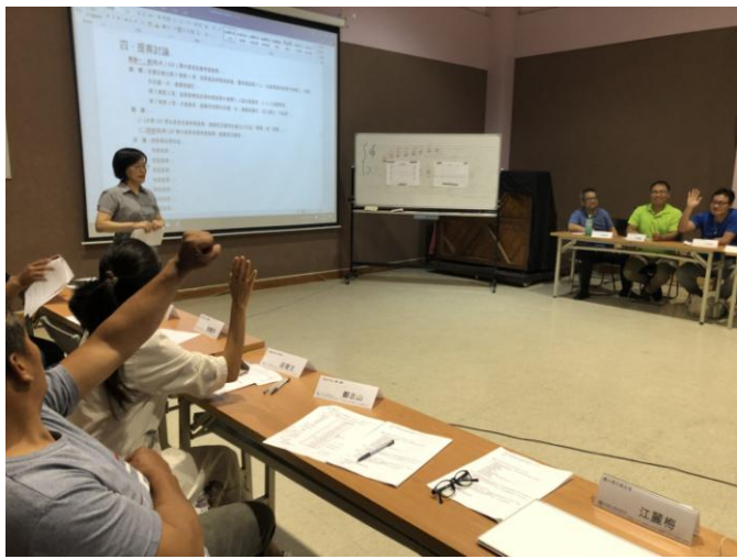
圖說：選(推)舉各項委員。