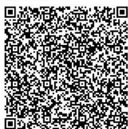
掃描QR碼以填寫學生接種意願